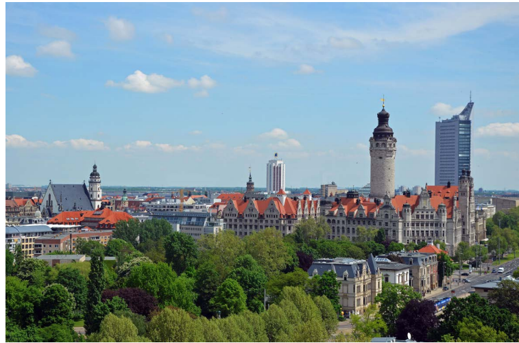
Skyline von Leipzig.